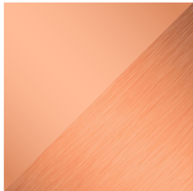
CO Cobre Copper | Pintura Paint CU Cobre Copper | Acabado metálico Metallic finish