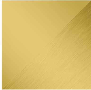
OR Dorado Gold | Pintura Paint AU Oro Gold | Acabado metálico Metallic finish