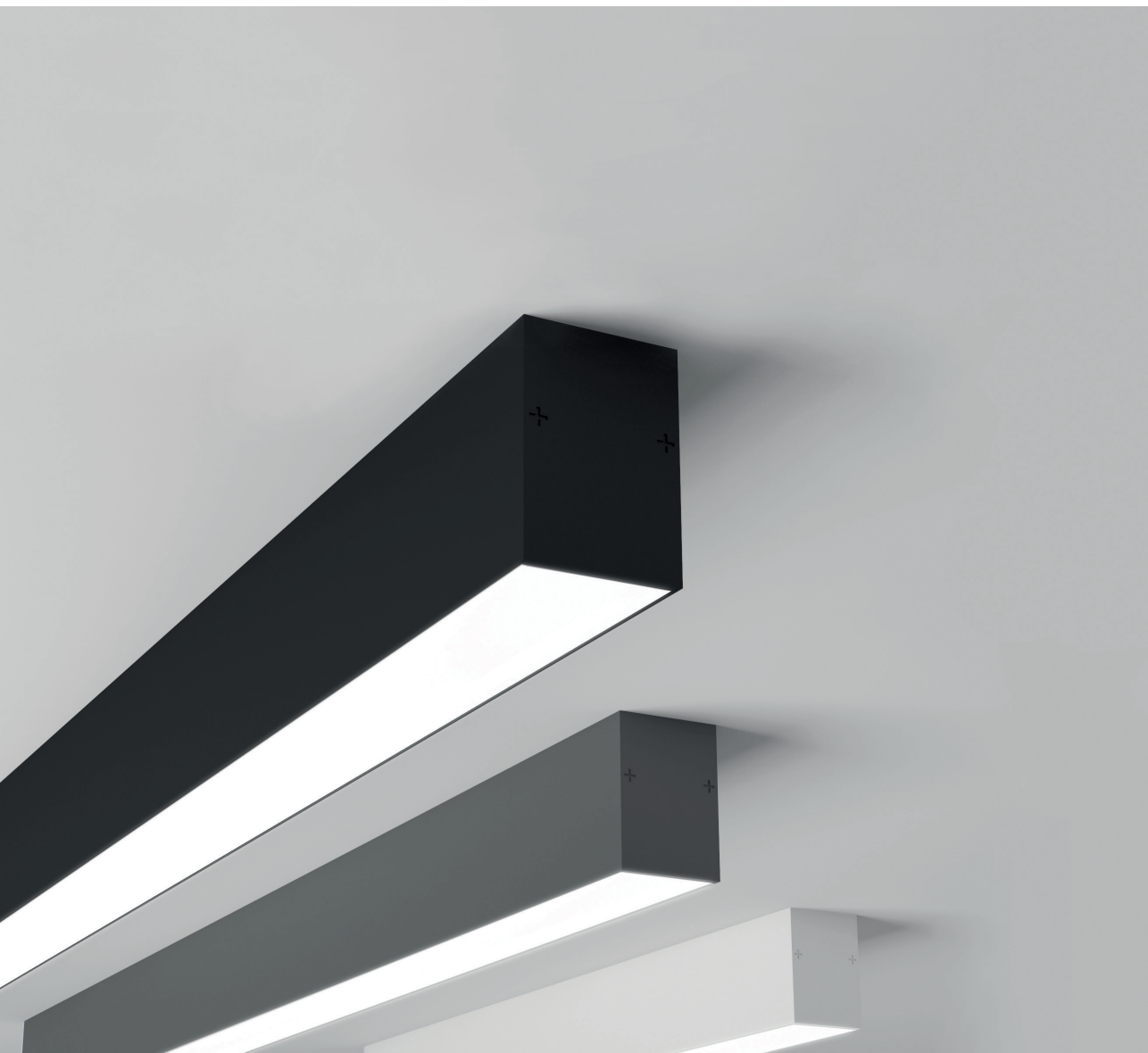
T04-11 30 NE, T04-11 30 RA 7045, T04-11 30 BL